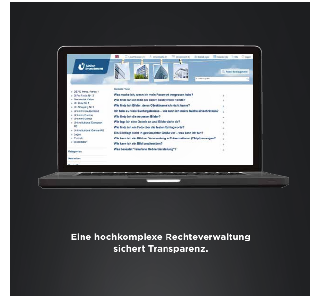
Eine hochkomplexe Rechteverwaltung sichert Transparenz.

Weitere Informationen unter www.mpm.de/dam