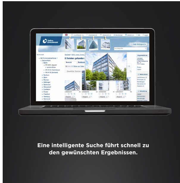
Eine intelligente Suche führt schnell zu den gewünschten Ergebnissen.

Nach dem Relaunch befinden sich in der Mediendatenbank von Union Investment knapp 8.000 Bilder mit 360 GB Speicherplatz. Mit ihrer deutlich erweiterten Funktionalität erreicht sie die Leistungsstandards der Bilderpools internationaler Fotoagenturen. Die hochkomplexe Rechteverwaltung lässt sich bis zum Einzelbild ausdifferenzieren. Verschiedene Nutzergruppen von der Marketingabteilung bis hin zu Pressevertretern wurden mit genau definierten Zugriffsrechten ausgestattet. Außendienstmitarbeiter erhalten beispielsweise eine auf ihre Bedürfnisse abgestimmte Bildauflösung speziell für PowerPoint-Präsentationen. Union Investment profitiert zusätzlich vom Support der MPM-Spezialisten.