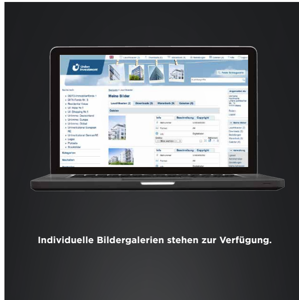
Individuelle Bildergalerien stehen zur Verfügung.